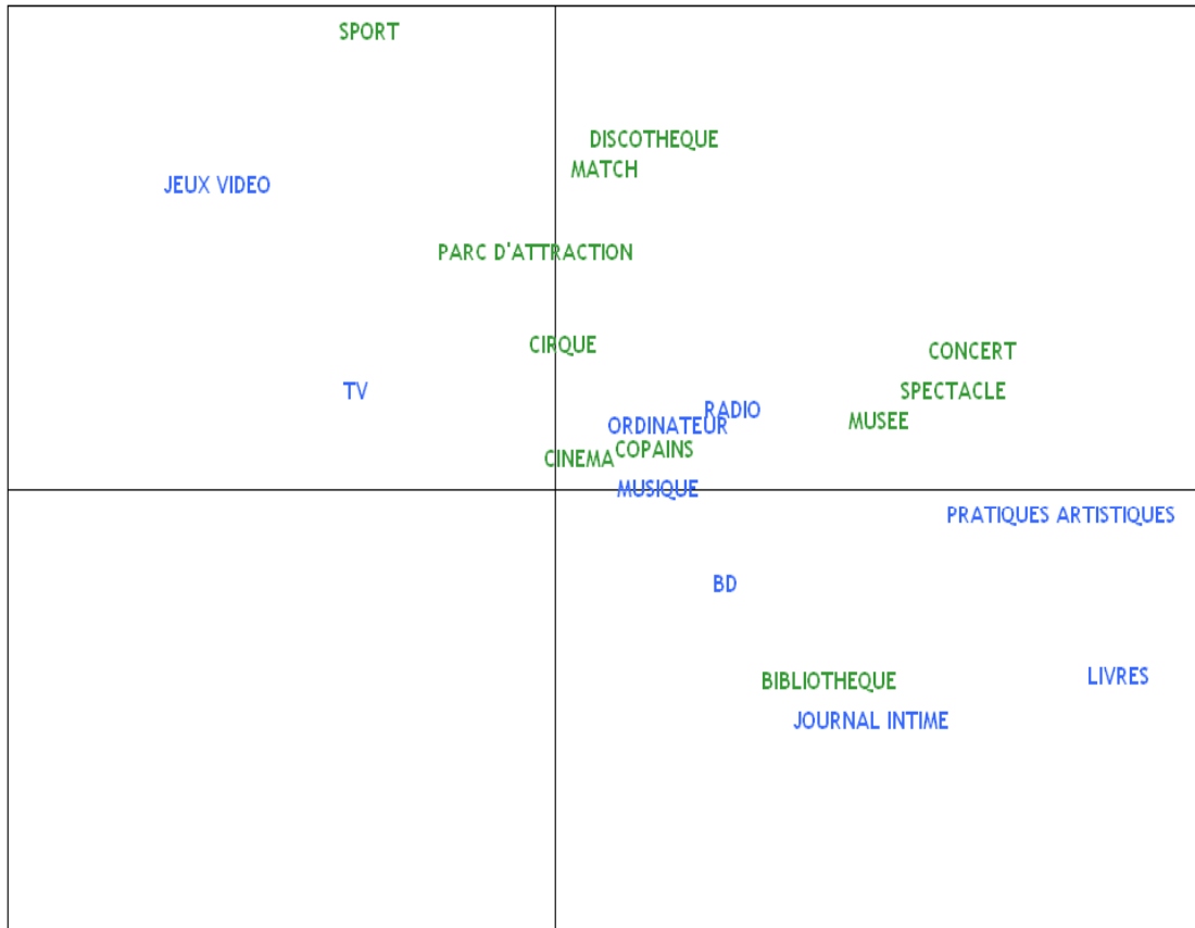
Graphique 3. L'espace des comportements culturels des adolescents à 17 ans

Champ : Tous les adolescents.